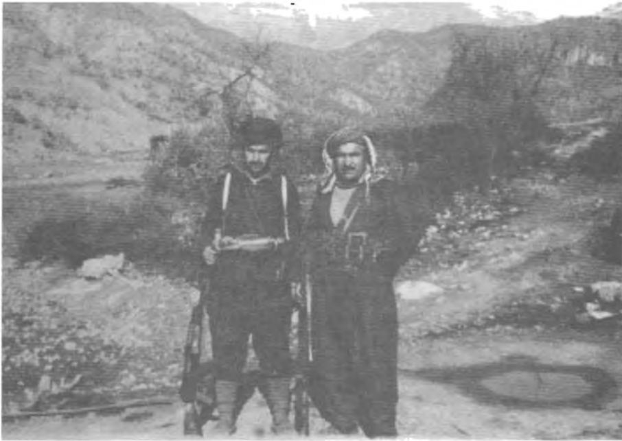
سره‌تای ۱۹۶۳ له‌گه‌ل عومه‌ر ده‌بابه